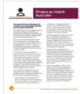
Drogue au volant: Australie