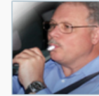
Alcohol Interlock Curriculum for Practitioners