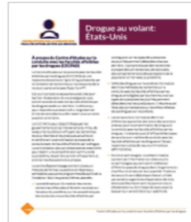
Drogue au volant: États-Unis