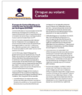
Drogue au volant: Canada