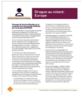
Drogue au volant: Europe