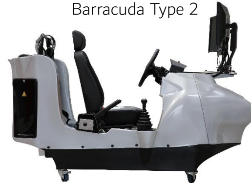
Barracuda Type 2